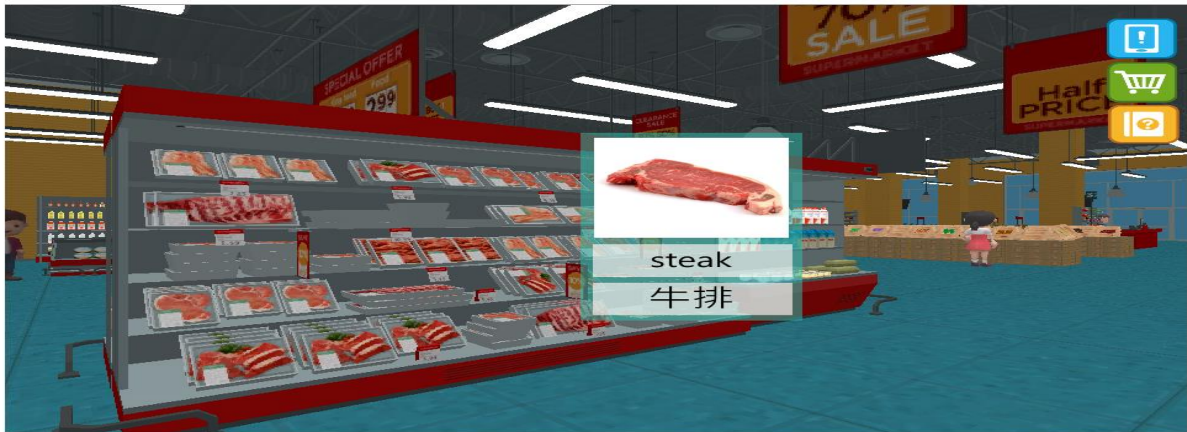
圖二、英語村 虛擬學習場景範例

計畫開發一座 3D 虛擬的「線上英語村」開始，至今已推出 3D 立體的虛擬主題環境：「超市」及「廚房」兩種場景，讓學生透過網路進入場景，並進行物品、常用對話/句型的學習，由於輕鬆、有趣的特色，此區內容廣受學生喜愛。持續增加學習內容與多種的 3D 生活場景，並將基本 1200 單字、常用生活短語/句型、基礎語法概念等納入場景之中，為學習者打造一個豐富有趣且推陳出新的學習環境。